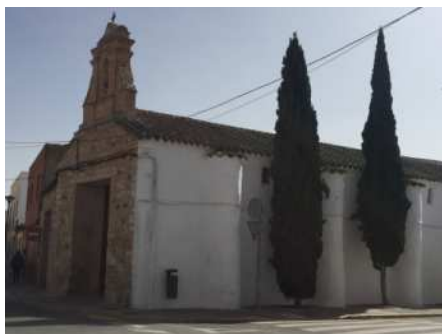
Ermita Ntra Sra de la Soledad