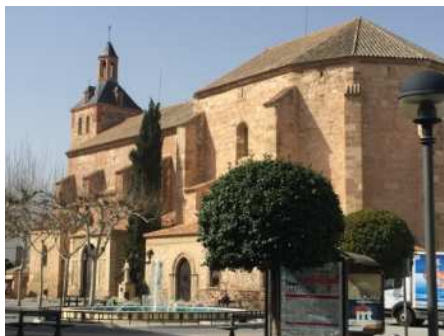
Parroquia Ntra Sra de la Asunción