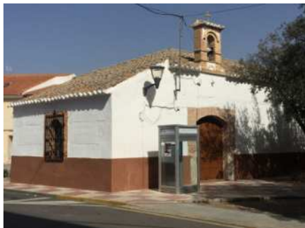
Ermita de San Antón