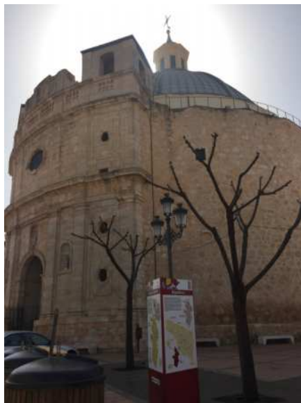
Ermita del Stmo Cristo de la Misericordia