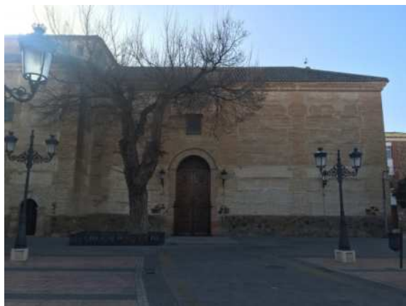
Ermita Ntra Sra de la Estrella